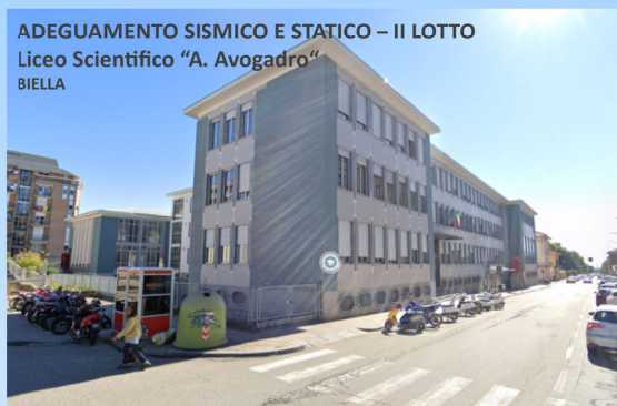
ADEGUAMENTO SISMICO E STATICO - II LOTTO Liceo Scientifico "A. Avogadro" BIELLA

PRIMO PIANO PROVINCE E CITTÀ METROPOLITANE