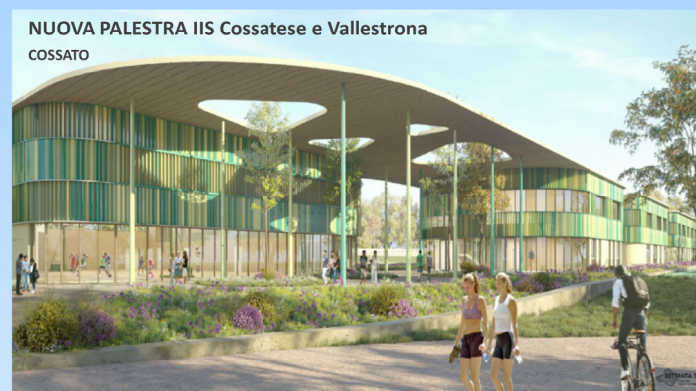
NUOVA PALESTRA IIS Cossatese e Vallestrona COSSATO

PRIMO PIANO PROVINCE E CITTÀ METROPOLITANE