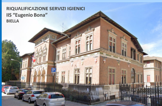
RIQUALIFICAZIONE SERVIZI IGIENICI IIS "Eugenio Bona" BIELLA