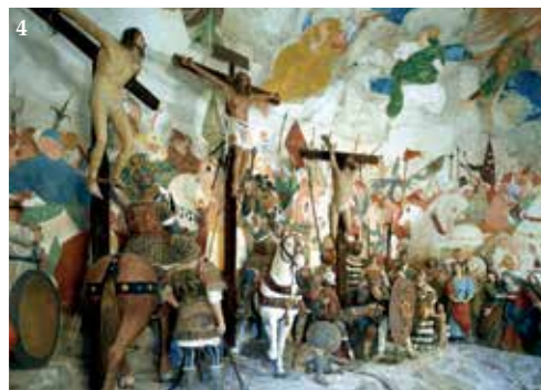
Foto grande: Isola San Giulio, lago d'Orta - Scenari srl. 1. Sacro Monte Orta S.Giulio - foto Dreste Pastore. 2. Sacro Monte Calvario Domodossola - SCENARI SRL. 3. Santuario Oropa - foto archivio Provincia. 4. Cappella XXXVIII - foto Studio Bonella. 5. Passione di Cristo - foto Istituzionale.