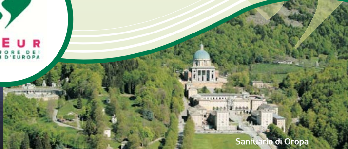
Sanuario di Oropa