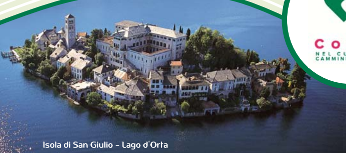
Isola di San Giulio - Lago d'Orta