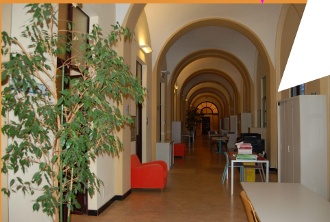
Nell'immagine: Voci di corridoio